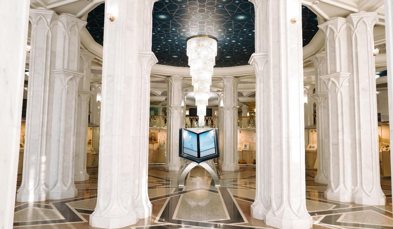
Это 1 этаж музея. Он выглядит так.