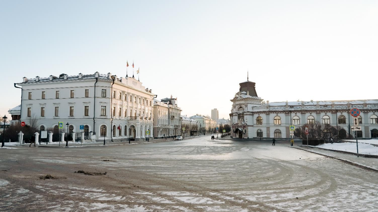
Это Площадь 1 мая. Здесь находится вход на территорию Казанского Кремля.