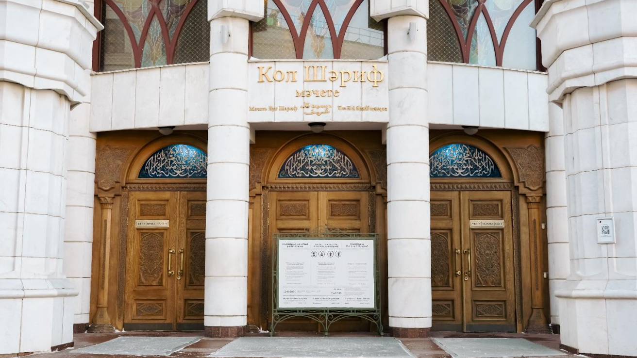
Вход в мечеть Кул Шариф выглядит так.