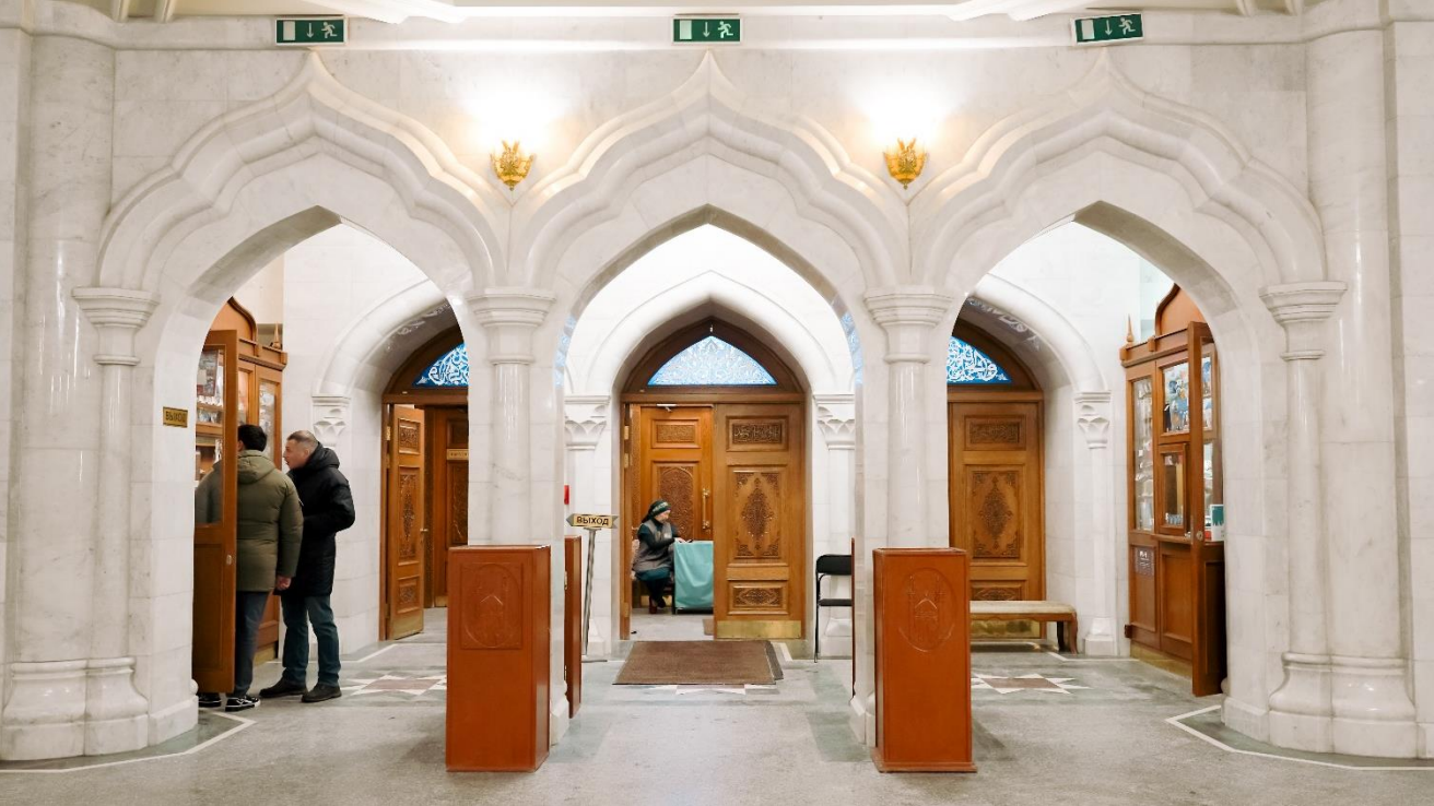
Выход из мечети выглядит так.