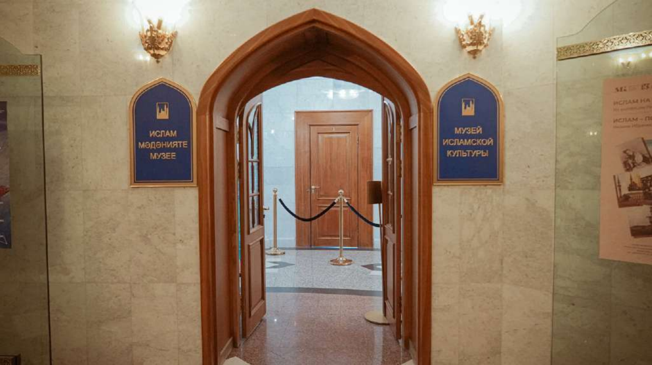
Вход в Музей исламской культуры выглядит так.