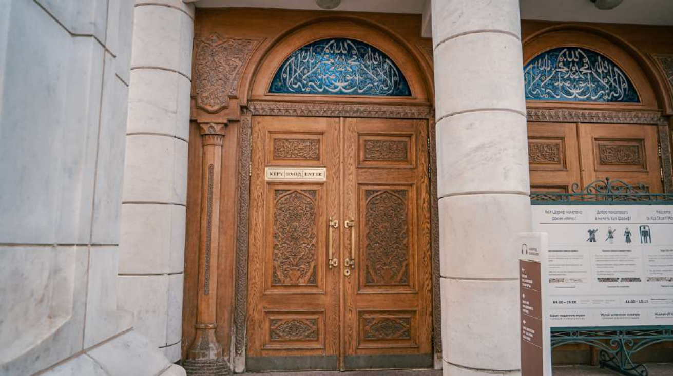
Вход в мечеть Кул Шариф выглядит так.