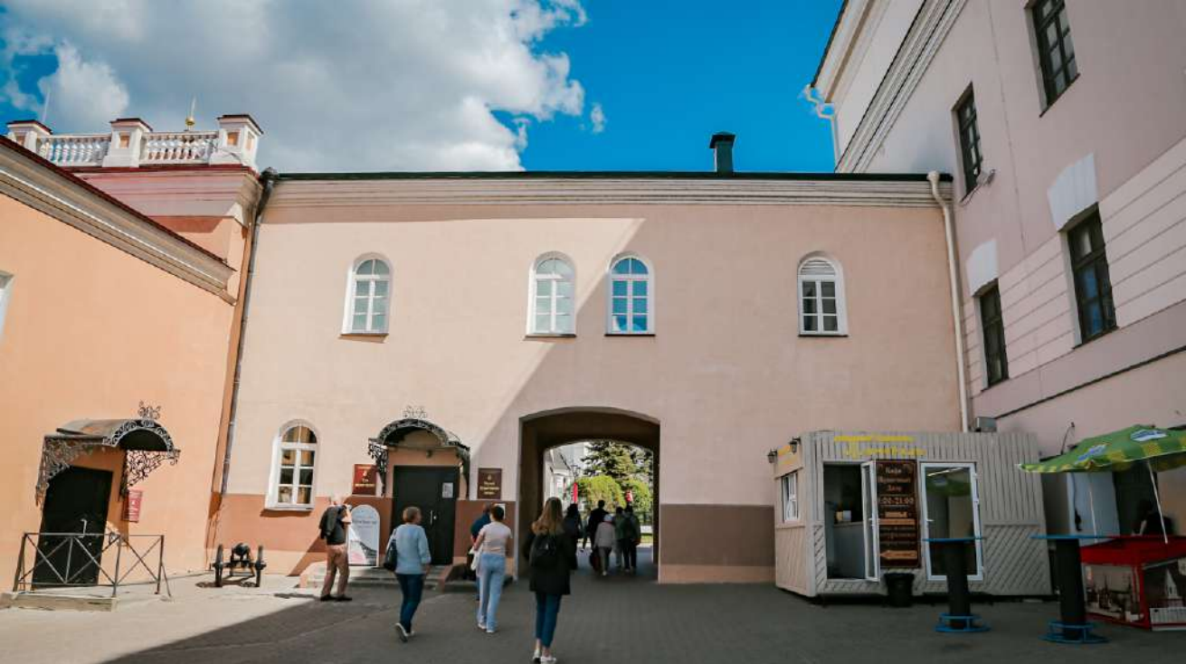
Здание Музея Пушкинского двора выглядит так.