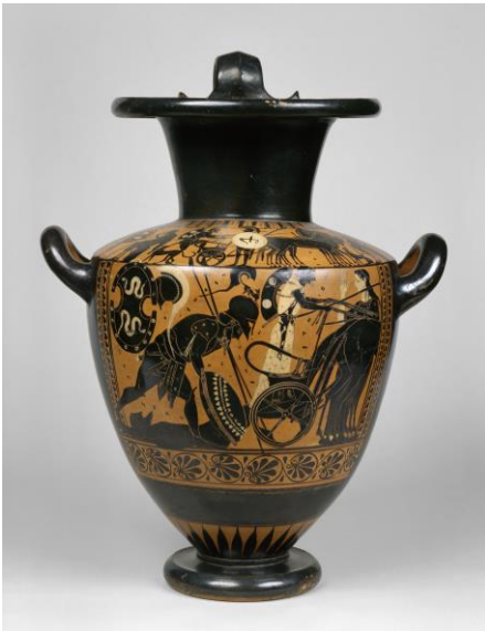
Гидрия чернофигурная Аттика, около 510 года до н.э. Группа Леагра, мастер Антиопы Государственный Эрмитаж

С деятельностью Александра Македонского принято связывать начало новой исторической эпохи. Восточный поход завоевателя – самый далекий в истории человечества военный поход – привел к разрушению Персидской империи, расширив границы греческой цивилизации. В эллинистическом искусстве черты Александра можно встретить повсюду – в портретах правителей, в статуях богов и героев и даже в декоративном искусстве. Образ великого царя, возникший в смешении традиций и культур, надолго пережил античную эпоху. В западноевропейских миниатюрах Александр изображался как странствующий рыцарь, в русском лубке XVII – XVIII веков – как авантюрный герой. В XIV – XV веках на Востоке Александр-Искандер – идеальный герой и грозный воин, в искусстве Возрождения – мудрый государь. Особенную актуальность «Истории Александра» приобрели в период абсолютных монархий при дворах правителей Франции, Англии, России.