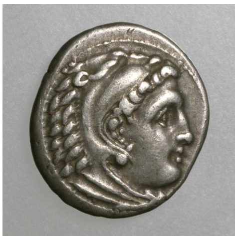
Монета (драхма) с изображением Александра Великого. Македония, 336 – 323 гг. до н.э. Государственный Эрмитаж

23 февраля 2022 года в Центре «Эрмитаж- Казань» открывается выставка «Александр Македонский. Путь на Восток». Государственный Эрмитаж представит в столице Татарстана масштабную эпопею, посвящённую самому великому царю и полководцу всех времён и народов. Около 400 экспонатов расскажут о Восточном походе Александра, о распространении греческой культуры на огромных территориях Азии и о величии классического искусства Эллады. Выставка станет центральным событием Дней Эрмитажа в Казани, которые пройдут с 21 по 23 февраля 2023 года.